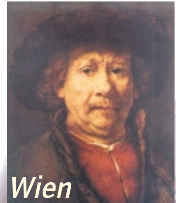
... Synonym für Geschichte, Musik, Kunst, Theater – hier Rembrandt im Kunsthistorischen Museum