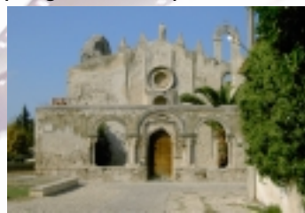
Ein Traum in Mosaik – die Martorana in Palermo