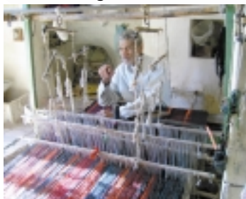
Web- und Knüpfteppiche entstehen im ganzen Land